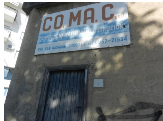
stato attuale dell'area. Dopo lo smantellamento dell'orditura secondaria e delle capriate. L'immobile svuotato di tutte sue caratteristiche stilistiche originarie presenta anche delle criticità evidenti relativamente alla sicurezza ed alla staticità.